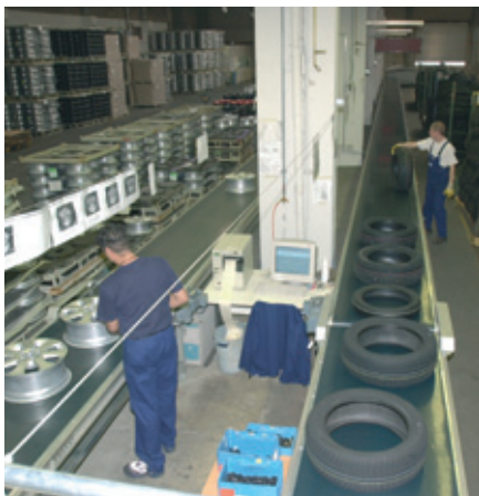
Kommissionierung der Reifen und Felgen Commissioning of tyres and rims