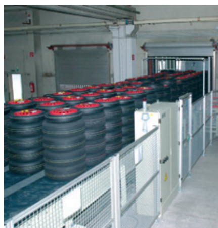
Einfördern der Räderstapel vom Speichergurt in den LKW Loading of wheel stacks from buffer belt into truck