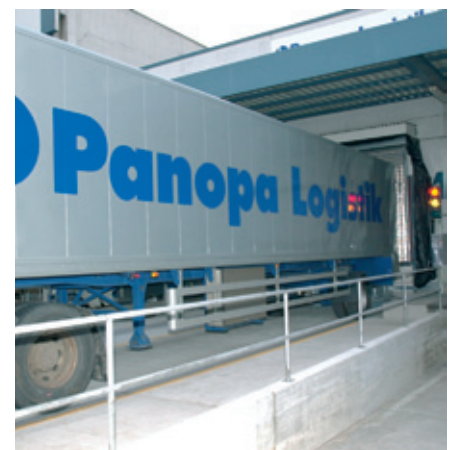
Angedockter LKW, abfahrbereit zur Montagelinie bei Opel-Leanfield Truck ready for departure to the assembly line at Opel-Leanfield