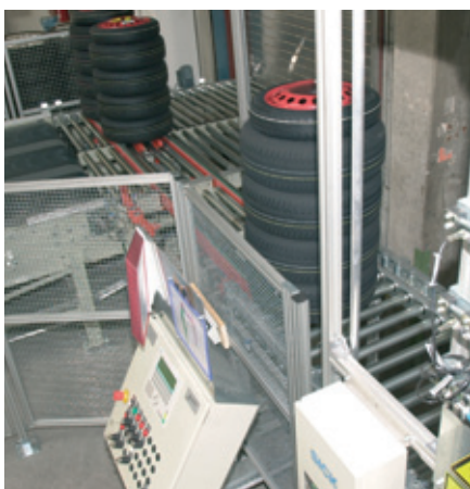
Befüllstation für Speichergurt Filling station for buffer belt