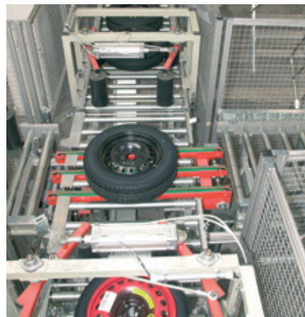
Fördertechnik für die Räderverteilung Conveying technology for wheel distribution